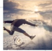
P3: MEINE GABEN