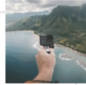
P4: MEIN AUFTRAG

EIN GUTER MENTOR BIST DU DANN, WENN DU DEN NEBEL LICHTEST UND DEN FOKUS AUF JESUS LENKST!