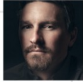
P2: MEIN CHARAKTER