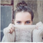
P1: MEINE IDENTITÄT (LEBEN MIT JESUS)